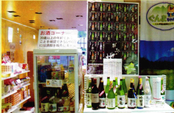
ぐんまちゃん家 1階 地酒コーナー